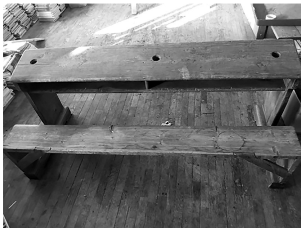
Slika 2. Školska klupa

U literaturi je opisana inovativna školska ploča na stalku koja se mogla prema potrebi dizati, spuštati i okretati oko svoje osi, tako da su se obje plohe mogle koristiti. Ispod nje je bila ruska računaljka. Na vrhu ploče je bila napeta žica na kojoj su se mogli izlagati zorni materijali (Prelog, 1895). Tijekom istraživanja u kopaničkoj školi nađena je ploča na stalku koja se mogla dizati, zelene boje s izvučenim linijama za pisanje. Pisalo se kredom, a brisalo navlaženom spužvom ili krpom. Ograničenja su joj teško dostupna gornja i donja mjesta. Učenici su za samostalni rad imali pločice dimenzija oko 20x40 cm. Na jednoj strani bile su izvučene linije, a na drugoj kockice. Pisalo se pisaljkom, a brisalo vlažnom spužvicom ili krpicom. U kopaničkoj školi ima više primjeraka sačuvanih učeničkih pločica.