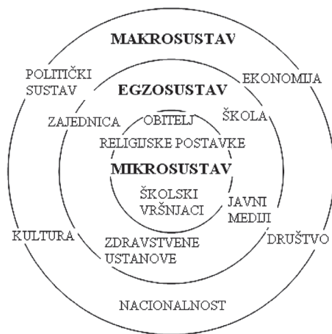
Slika 3. Religija unutar mikrosustava

Religija je » skup vjerovanja ili dogmi i postupaka bogoslužja kojima je određen čovjekov odnos s božanskom moći (jednoboštvo) ili natprirodnim silama « (Polić, 1997, 51) naspram ateizmu koji je »bez-